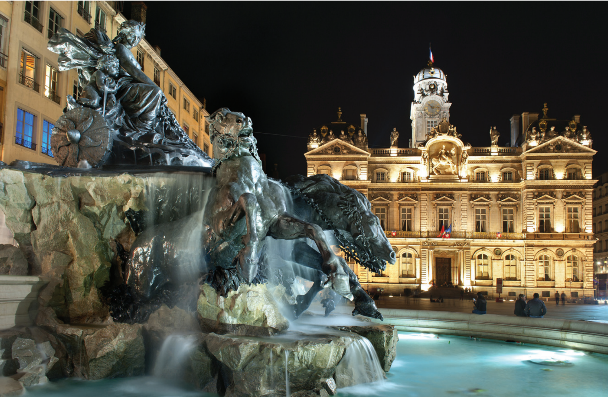
Texte : Pierre Deruaz

AOÛT En place des Terreaux, la liberté, sauvage et rénovée, aux naseaux fumants, s'évade à la fontaine Bartholdi entre l'hôtel de ville et le musée des Beaux-Arts. Un LYON qui se mouille aux artistes.